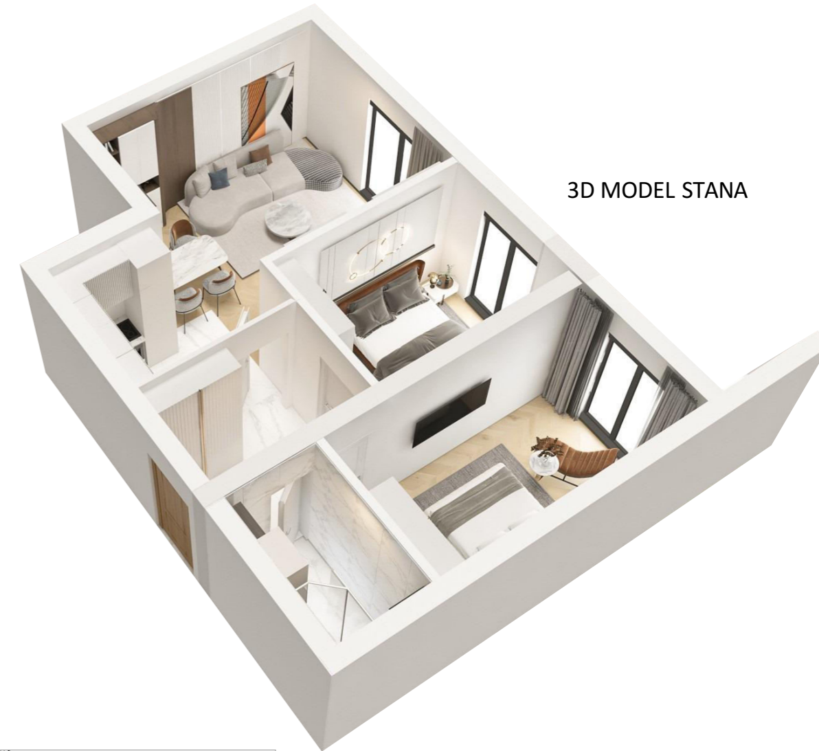
3D MODEL STANA